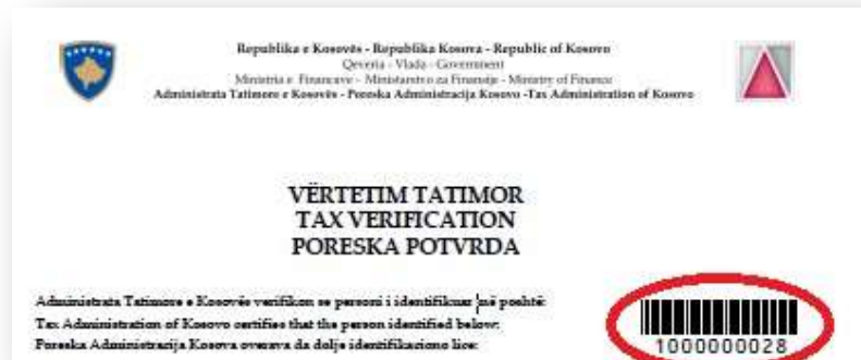
Slika 10: Serijski broj poreske potvrde