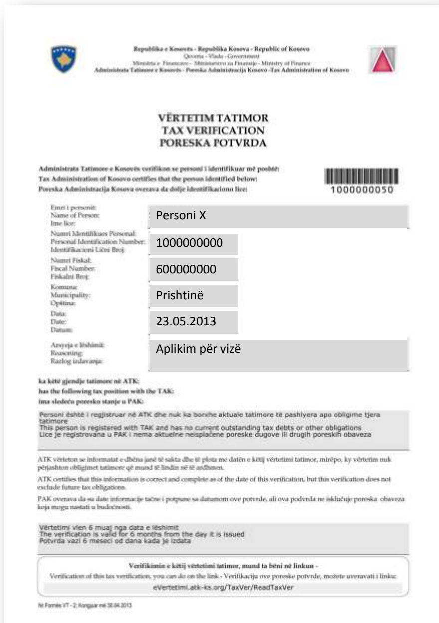
Slika 8: Poreska potvrda