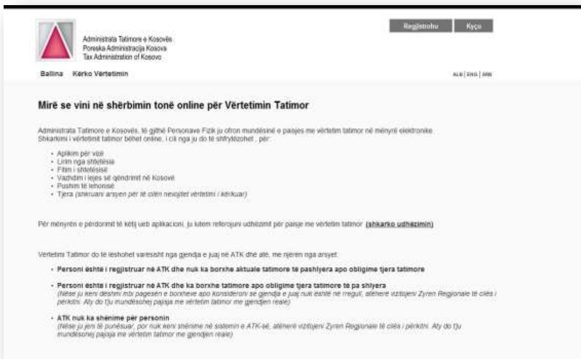
Slika 1: Naslovna aplikacije za izdavanje Poreske potvrde

Za preuzimanje poreske potvrde, korisnik pristupa vezi http://evertetimi.atk-ks.org/ na veb strani PAK-a www.atk-ks.org , prilikom čega se pojavljuje sledeća figura: