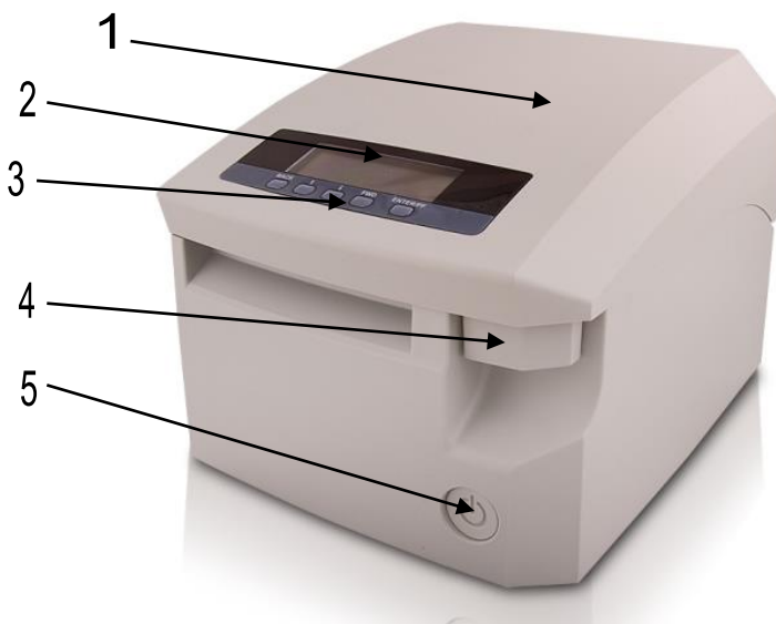
Printeri Fiskal FP 700+