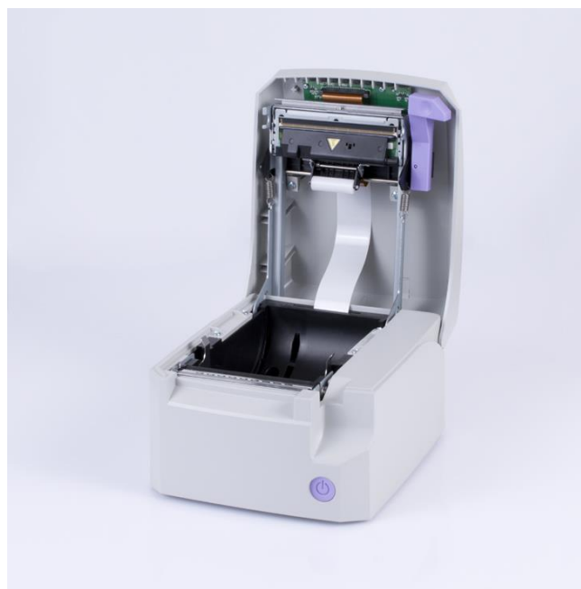
Pjesa e jashtme e Printerit Fiskal FP 700+